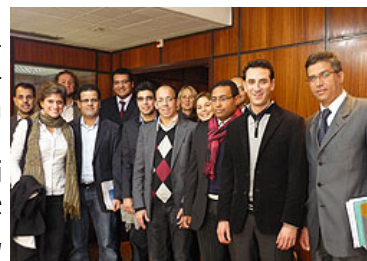
Besuch bei der Bank Al-Amal in Casablanca

Dazu ein Banker: „Marokko ist noch nicht virtualisiert. Marokko ist dabei sich zu verändern, aber wir sind immer noch ein Entwicklungsland. Um die Dinge in Marokko zum Besseren zu verändern, brauchen wir ja gerade sie, Ihr Fachwissen und Ihre guten Geschäftsideen aus dem Ausland.“